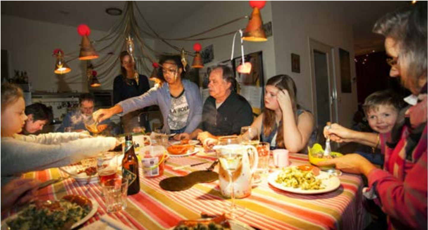
Aan tafel bij de GezinsKring in Houten (2014).

komen. De kracht van onze gemeenschapsvorming is dat zelfs kinderen met complexe zorgvragen bij ons tot rust en ontwikkeling kunnen komen.”